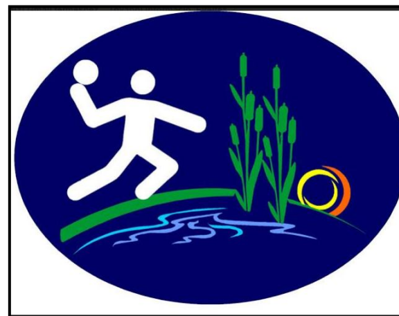
Lajosmizsei Fekete István Sportiskolai Általános Iskola új logója.