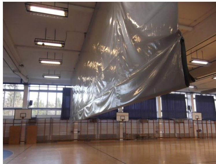
és a felújított sportcsarnok.