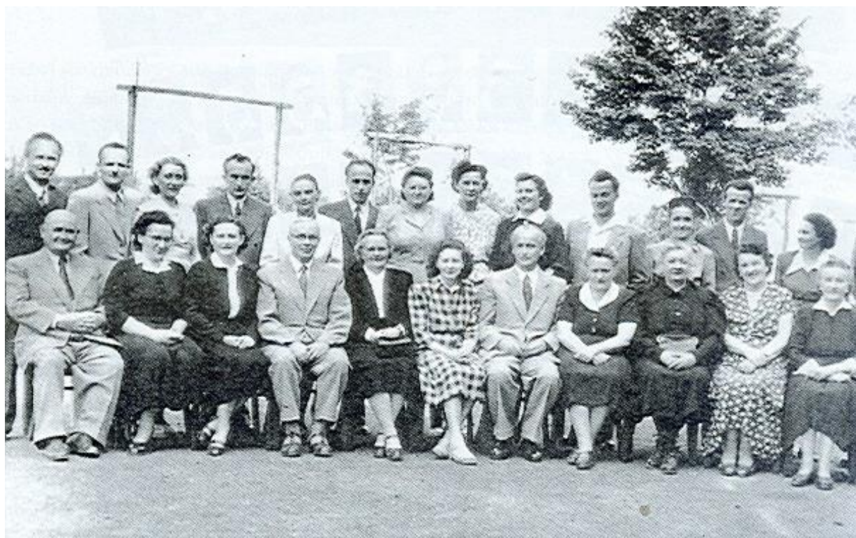
A Központi Általános Iskola tantestületének tanári kara 1956-ban.