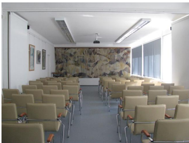
Az iskolai alapítvány sikeres pályázata kapcsán kialakított díszterem.