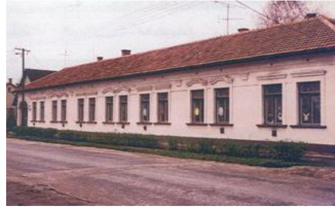
Szent Lajos Iskola