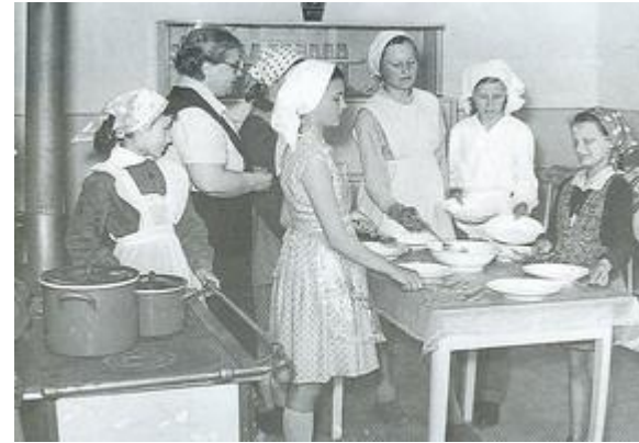
A kép az 1960-as években készült.