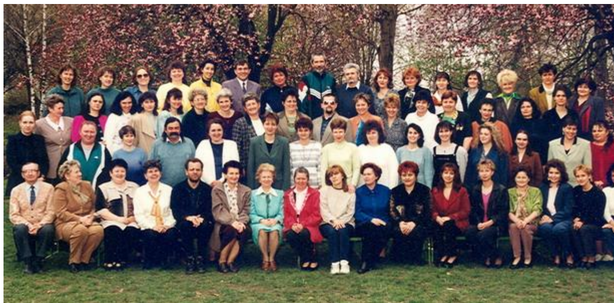
Az iskola tantestülete 2000-ben