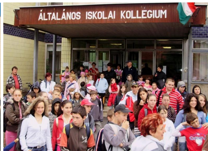
Kollégisták készülődése a kirándulásra