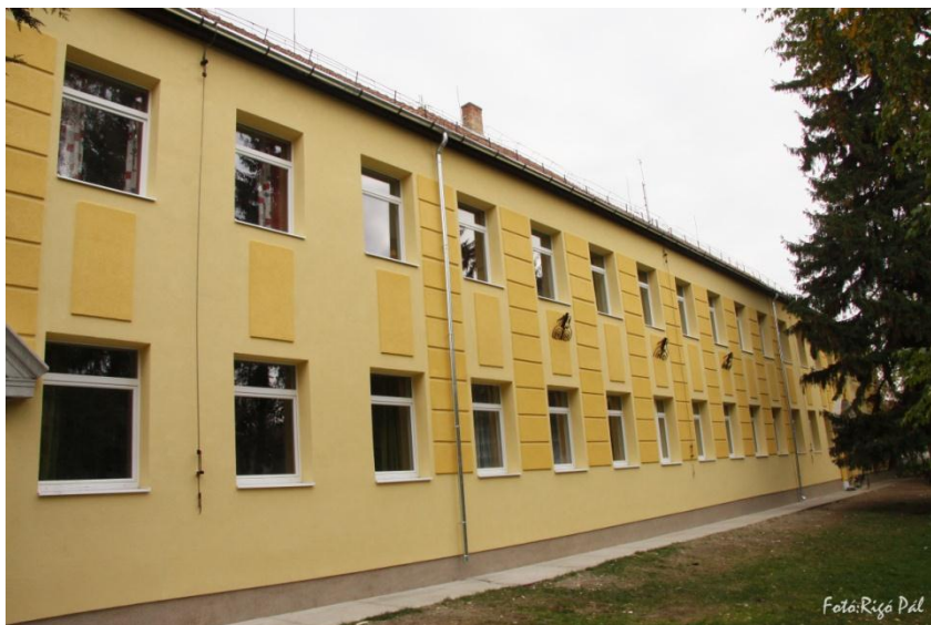
A működtető által felújított homlokzat az új nyílászárókkal,