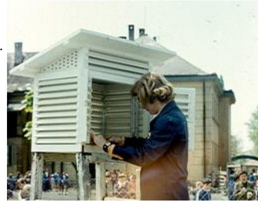
Észlel Móra Ferenc (1975)

minimum és maximum értékeket, a levegő páratartalmát, a szél irányát, erősségét, a légnyomást, a hullott csapadék mennyiségét, az égbolt felhőzettségét, a havas napok számát.